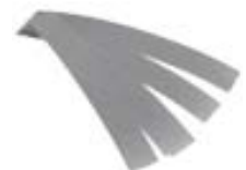
Reflective Tape Model CDT-TAPE