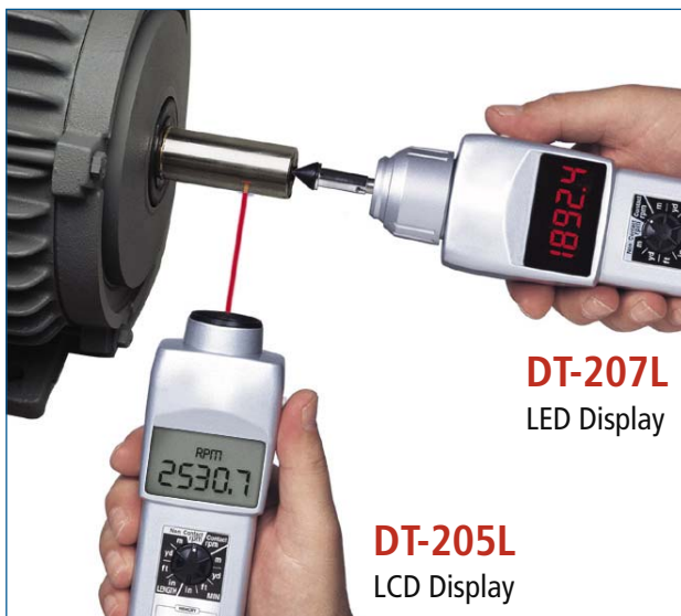
DT-207L LED Display

These CHECK•LINE® models combine the best features found in both contact and non-contact tachometers for the accurate measurement of rpm, surface speed and length. The screw-in contact adapter makes it quick & easy to convert from non-contact to contact operation.