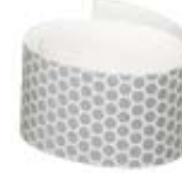
Reflective Tape Model L205T