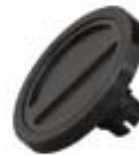
6" Measuring Wheel Model DT6