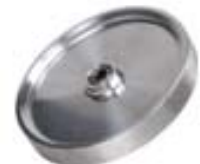
12" Measuring Wheel Model LMA-3